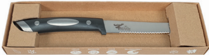
Standard Lasergravur „Label Moose“