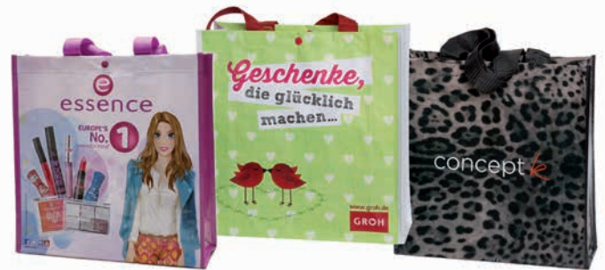
Kleiner Shopper 35 x 35 x 12 cm, Beispiel Druckknopf in Sonderfarbe

Die Werbetaschen sind zu 50 % aus recycelten PET-Flaschen hergestellt und zu 100 % recycelbar. Sie bestehen aus gewebtem Material, sind mit einem Druckknopf verschließbar und tragen bis 25 kg. Die Taschen sind platzsparend faltbar, robust und dauerhaft, so dass sie lange wiederverwendet werden. Ein günstiger und nachhaltiger Werbeartikel, der Ihre Botschaft großflächig transportiert. Dabei können der Druckknopf und die Einfassung sogar in Sonderfarbe nach Pantone gestaltet werden.