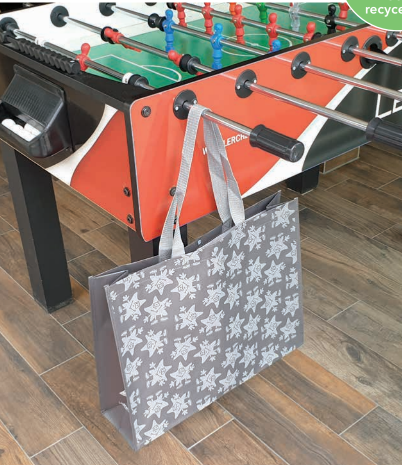
Großer Shopper 47 x 35 x 12 cm