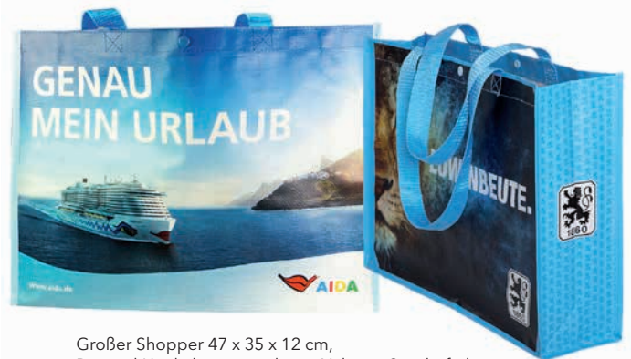
Großer Shopper 47 x 35 x 12 cm, Beispiel Henkel aus gewebtem Nylon in Sonderfarbe