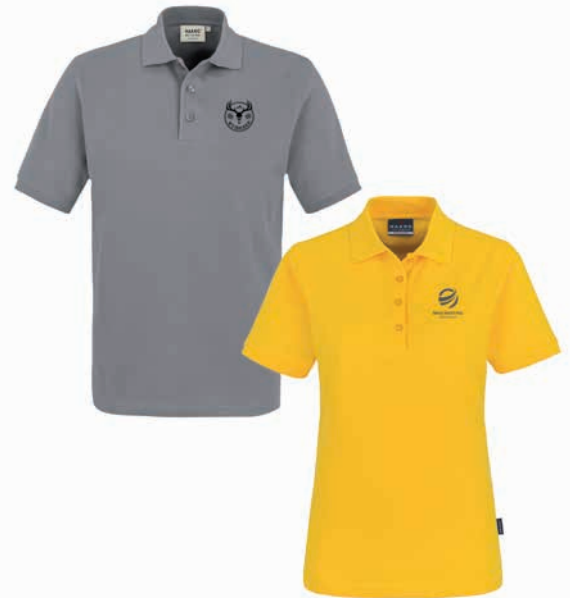
Herrenmodell und tailliertes Damenmodell, Beispiele Stick und Druck