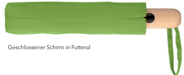
Geschlossener Schirm in Futteral