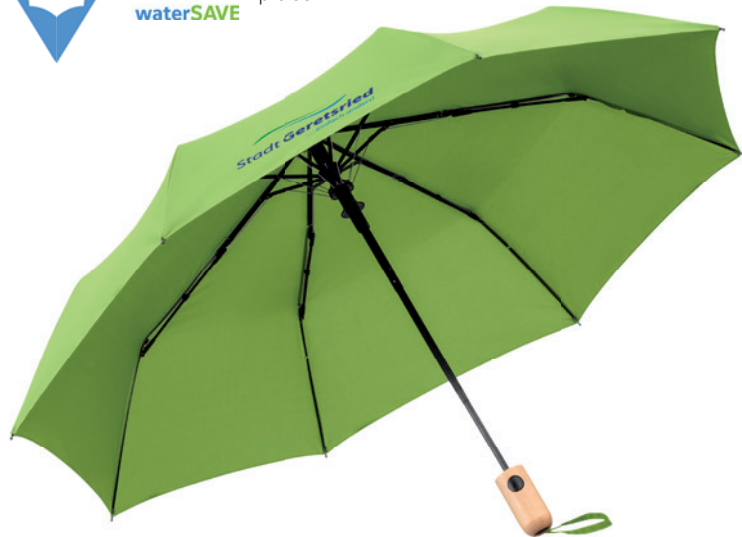
AC Taschenschirm ÖkoBrella mit Doppelautomatik-Funktion, Beispiel Siebdruck

Komfortable Doppelautomatik-Funktion zum schnellen Öffnen und Schließen, hochwertiges Windproof-System für eine maximale Gestell-Flexibilität bei stärkeren Windböen, STANDARD 100 by OEKO-TEX® zertifiziertes Polyester-Pongee Bezugsmaterial aus recycelten Kunststoffen, Bambusgriff mit schwarzer Auslösetaste. Viele interessante Möglichkeiten zur Werbeanbringung.