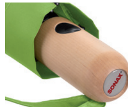
Beispiel Doming auf Griff