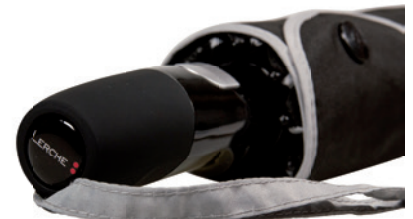
Beispiel Doming auf Griff

Unser Produkt online: « Bitte hier scannen! »