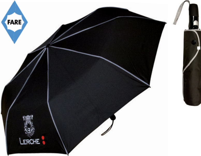
AOC Oversize-Taschenschirm Seam, Beispiel Siebdruck und Doming auf Griff

Farbige Highlights als Blickfang, eine komfortable Doppelautomatik-Funktion zum schnellen Öffnen und Schließen und ein hochwertiges Windproof-System für eine maximale Gestell-Flexibilität zeichnen den Oversize-Taschenschirm aus. Werbeanbringungsmöglichkeit am Soft-Touch-Griff (matt oder glänzend) mit integrierter Auslösetaste, farbige Griffschleife und Futteral mit Druckknopf und Paspelierung.