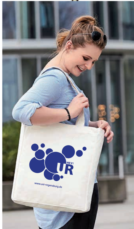
Beispiel Shopper ORGANIC (283 g/m 2 ) mit Siebdruck

Artikelnummer: 8604-0501-1743 (FAIR) 8604-0501-1744 (ORGANIC) Material: FAIR: Baumwolle 5 OZ (140g/m 2 ) ORGANIC: Bio-Baumwolle 10 OZ (283g/m 2 ) Größe: FAIR: 38 x 42 cm ORGANIC: 36 x 40 x 10 cm Druckart: Siebdruck Weitere Druckarten auf Anfrage Werbefläche: auf der Front FAIR: 28 x 33 cm ORGANIC: 28 x 30 cm