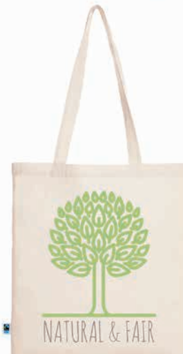
Shopper FAIR ohne Bodenfalte 38 x 42 cm (140 g/m 2 )

Lieferzeit: ca. 4 Wochen nach Produktionsfreigabe | Fixtermin? Fragen Sie nach unserem Express-Service!