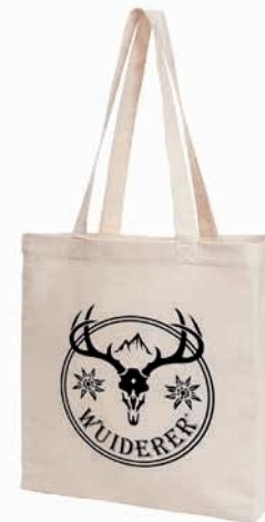
Shopper ORGANIC mit Bodenfalte 36 x 40 x 10 cm (283 g/m 2 )