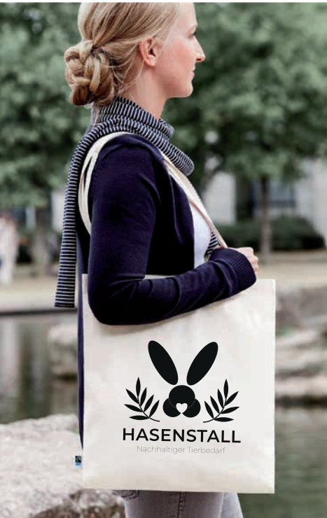
Beispiel Shopper FAIR (140 g/m 2 ) mit Siebdruck