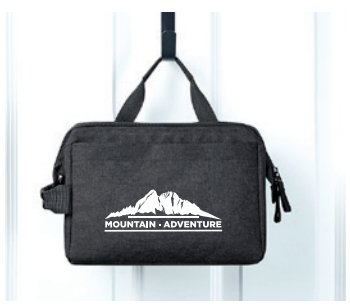
Mit praktischer Aufhängung

Praktische Kulturtasche CIRCLE mit Material aus recycelten PET-Flaschen : Die Universaltasche macht es allen, die nicht gerne herumkramen, jetzt noch einfacher, den Überblick zu behalten. : Dank eines Metallbügels bleibt die Tasche weit offen und kann aufgehängt oder aufgestellt werden zudem ist sie gepolstert. : Mit Ihrem Logo oder Wunschkmotiv bedruckt als idealer Begleiter für den Urlaub oder die nächste Geschäftsreise.