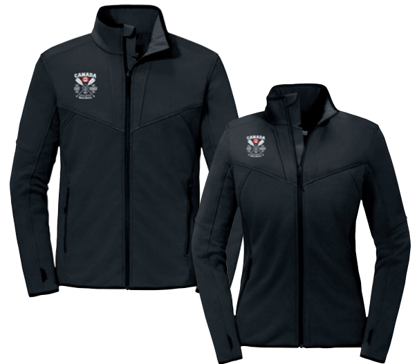
Jacke EINHEIZER Zipln, Herren- und Damenmodell, Beispiel Logodruck

Unser Produkt online: « Bitte hier scannen!