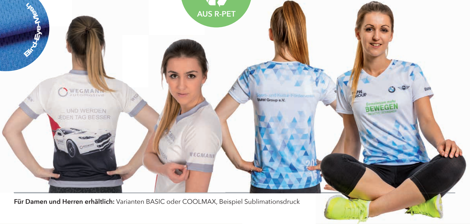
Für Damen und Herren erhältlich: Varianten BASIC oder COOLMAX, Beispiel Sublimationsdruck

Atmungsaktives Damen- oder Herren-Laufshirt in verschiedenen Schnittformen: wahlweise Kugel- oder Raglanarm sowie Rundhals- oder V-Ausschnitt. Sie können wählen zwischen der Variante BASIC, bestehend aus atmungsaktivem Polyester, das strukturiert (Bird-Eye-Mesh, s. o.) oder glatt erhältlich ist. Die Variante COOLMAX besteht aus COOLMAX®-Polyester. Dabei haben die Fasern eine 25 % größere Oberfläche als normale Fasern, so dass Feuchtigkeit schneller transportiert wird.