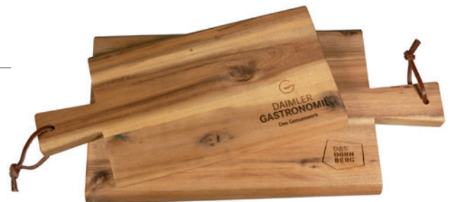
Schneidebrett Akazie, klein, 29 x 14 x 1,5 cm (Einbrand) und Schneidebrett Akazie, groß, 35 x 18 x 1,5 cm (Lasergravur)