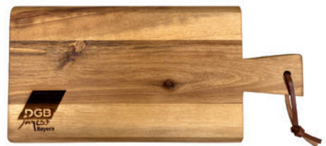
Schneidebrett Akazie, klein, 29 x 14 x 1,5 cm Beispiel Lasergravur

Lieferzeit: ca. 3-4 Wochen nach Produktionsfreigabe | Fixtermin? Fragen Sie nach unserem Express-Service!