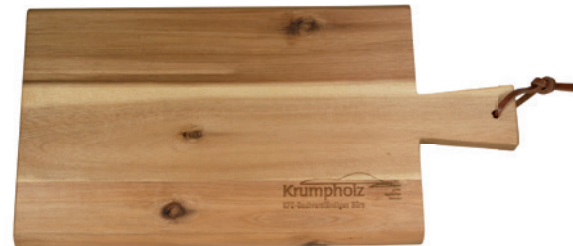
Schneidebrett Akazie groß, 35 x 18 x 1,5 cm Beispiel Lasergravur