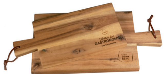
Schneidebrett Akazie, klein, 29 x 14 x 1,5 cm (Einbrand) und Schneidebrett Akazie, groß, 35 x 18 x 1,5 cm (Lasergravur)