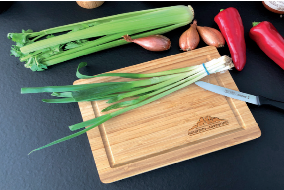
Profi-Schneidebrett aus Bambus mit Safrille, Beispiel Laserggravur