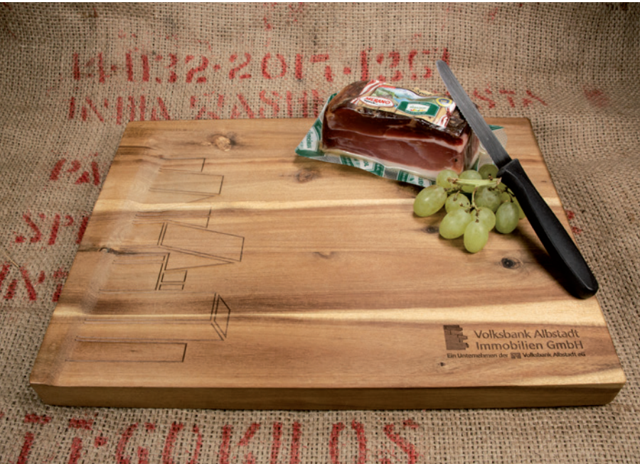
Schneide- und Servierbrett mit abfallender Schneidefläche, Beispiel Lasergravur