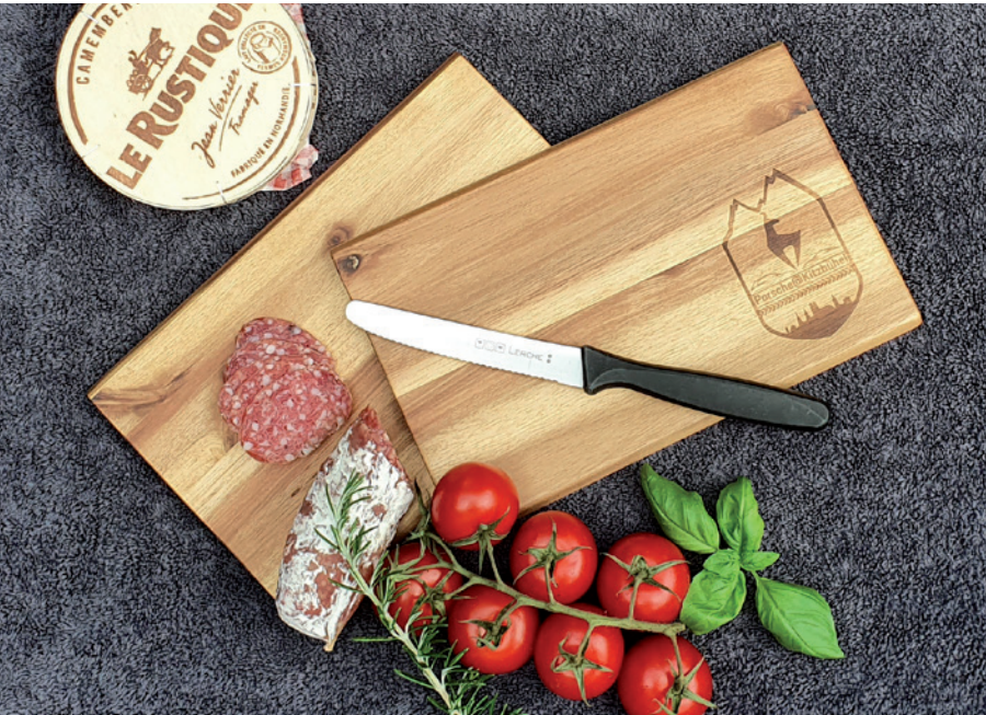
Frühstücksbrettchen aus Akazienholz, Beispiel Lasergravur