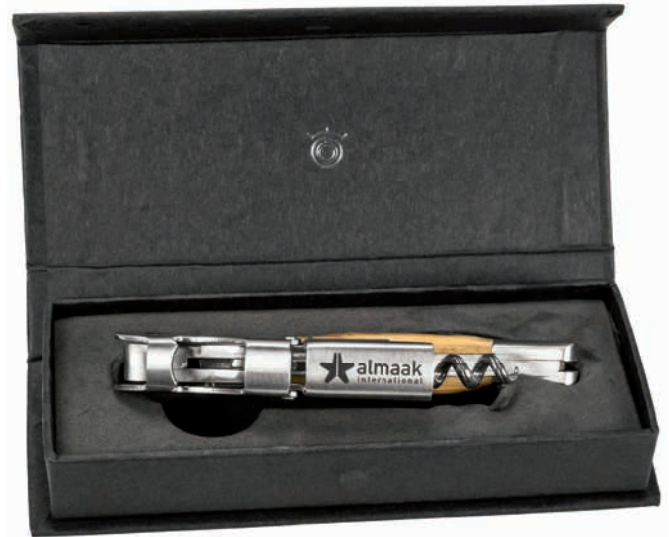
Beispiel Lasergravur auf Ansatzhebel

Das professionelle Kellnermesser hat einen Doppelhebel, einen Griff aus Olivenholz mit zwei Vollmetallkronen sowie einen Korkenzieher. Eine fein gezahnte Klinge zur Entfernung der Weinmanschette und ein Flaschenöffner sind inklusive. Geliefert wird dieses Kellnermesser in einem hochwertigen Geschenkkästchen aus schwarzem Karton. Die Werbeanbringung erfolgt als hochwertige Lasergravur.