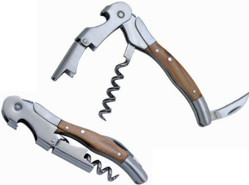
Beispiel Lasergravur auf Ansatzhebel

Artikelnummer: 6037-0600-2029 Material: Edelstahl, Olivenholz Größe: 11,6 x 2,7 x 1,6 cm / Klingenlänge: 4,6 cm / 165 g Farben: silbern, holzfarben Druckart: Lasergravur Werbefläche: 2,5 x 0,8 cm (Lasergravur auf Ansatzhebel)