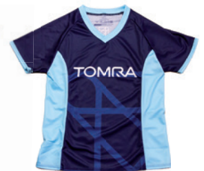
Damen-Shirt mit Kugelarm und V-Ausschnitt

Lieferzeit: ca. 2 Wochen nach Produktionsfreigabe | Fixtermin? Fragen Sie nach unserem Express-Service!