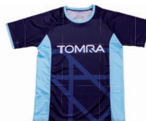
Herren-Shirt mit Raglanarm und Rundhals-Ausschnitt

Unser Produkt online: « Bitte hier scannen!