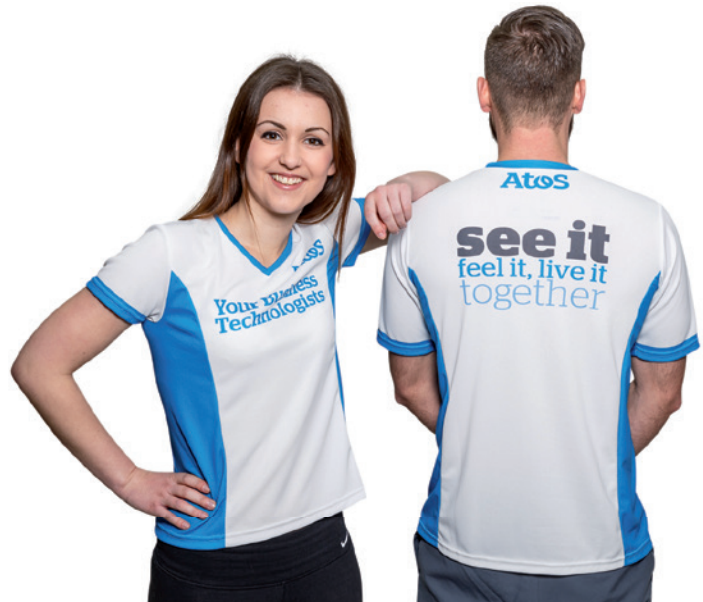
Damen-Shirt mit V-Ausschnitt, Herren-Shirt mit Rundhals-Ausschnitt, Beispiel Allover-Sublimationsdruck

Damen- oder Herren-Laufshirt mit individuellem, vollflächigem 4-farbigem Sublimationsdruck. Das Shirt ist erhältlich in Kugelarm- oder Raglanarm-Schnitt sowie mit Rundhals oder V-Ausschnitt. COOL PLUS ist ein Funktionsmaterial für höchste Ansprüche: es wirkt direkt auf der Faser-oberfläche und nicht auf der Haut. So hemmt es die mikrobielle Geruchs-entwicklung in Textilien und ist auf Körperverträglichkeit getestet.