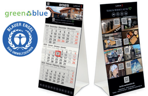
Mini-Kalender 3 green+blue, Beispiel 4C-Druck beidseitig

Lieferzeit: ca. 4 Wochen nach Produktionsfreigabe | Fixtermin? Fragen Sie nach unserem Express-Service!