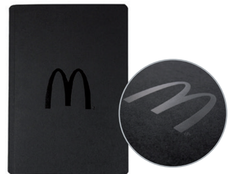
Beispiel A5 mit schwarz glänzender Logoprägung

Lieferzeit: ca. 3 Wochen nach Produktionsfreigabe | Fixtermin? Fragen Sie nach unserem Express-Service!