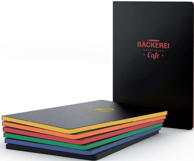
Beispiel Tablet-Book mit Farbschnitt in sechs Farben und farblich passender Prägung

Das Tablet-Book Slim ist in den Größen A4, A5 und Pocket erhältlich. Es hat zwei abgerundete Ecken (Buchblock und Decke) und eine Broschur mit Klebebindung. Die Notizseiten mit Winkelkaro bestehen aus hochweißem Schreibpapier 90 g/m 2 (Pocket 80 g/m 2 ). Der Farbschnitt an der Seite ist in gelb, grün, mittelblau, orange, rot oder schwarz erhältlich. Die Ton-in-Ton Prägung mit Ihrem Logo ist inklusive.