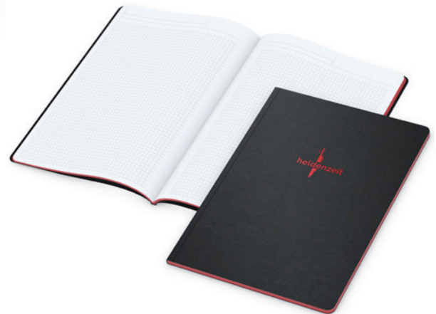
Beispiel A4 mit Farbprägung und Farbschnitt in rot