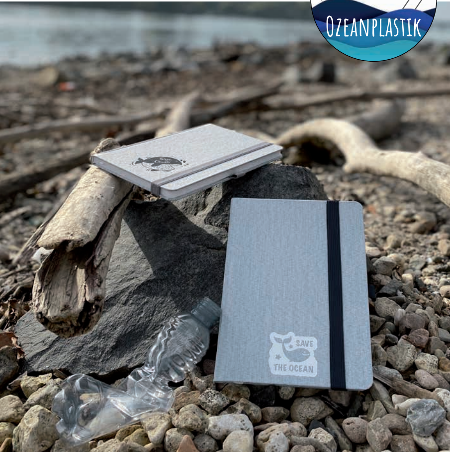
Ocean-Book WAVE, Beispiel grauer Einband/schwarze Prägung und blauer Einband/weiße Prägung