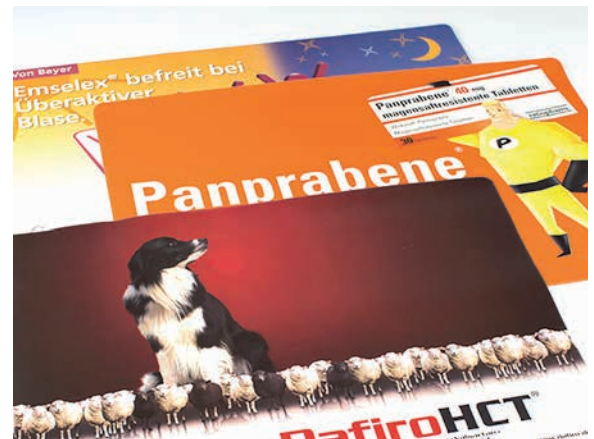
Beispiel fotorealistischer Digitaldruck

Lieferzeit: ca. 5-6 Wochen nach Produktionsfreigabe | Fixtermin? Fragen Sie nach unserem Express-Service!