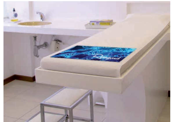
Beispiel rutschfeste Unterseite

Die Auflage ist ein nützlicher Helfer für den Arbeitsalltag im Büro, in der Werkstatt oder in der Arztpraxis. Sie ist verwendbar als Schreibtischunterlage, Behandlungsstuhl-Auflage oder Fußauflage und bietet Schutz und Werbung zugleich. Sie zeichnet sich durch besondere Kratz- und Abriebfestigkeit aus und hat viel Platz für ihr individuelles Motiv. Auch mit weißer Folierung mit Schutzlack, Papiereinleger oder Liquidfüllung möglich.