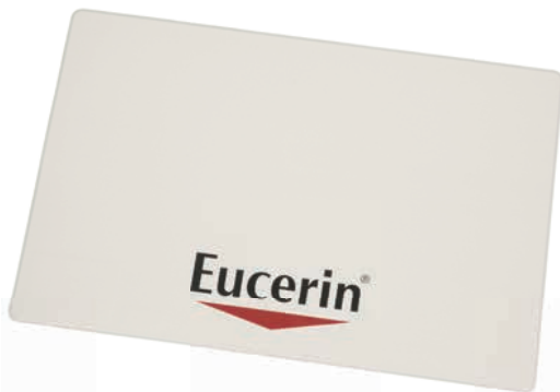
Beispiel weiße Folierung mit Schutzlack versiegelt (auf Anfrage)

Preise inkl. Druck -und Nebenkosten. PDF-Korrekturabzug zur Freigabe. Mengentoleranz +/- 10 %. Aufpreis von ca. 1500 € bei größerem Format. Frachtkosten nach Aufwand.