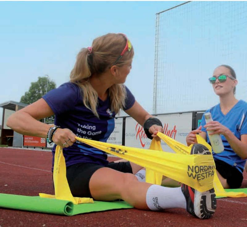
Fitnessband, Beispiel Aufdruck schwarz