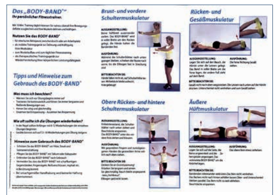
Faltblatt mit Übungsanleitungen