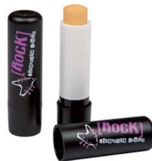
Lipcare ORIGINAL, Beispiel schwarz, mit 2c-Siebdruck