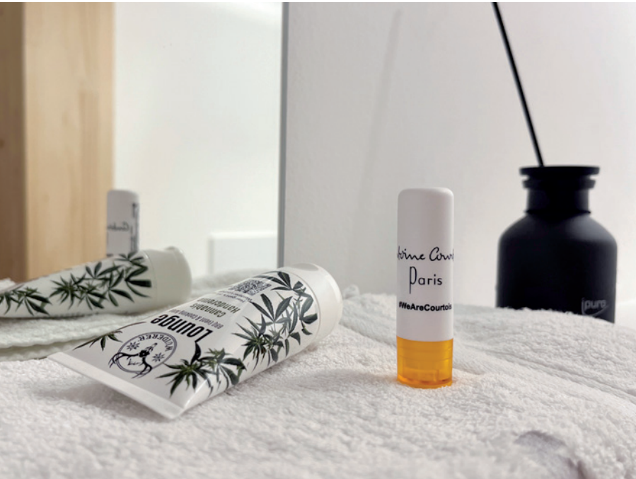
Lippenpflegestift LIPCARE ORIGINAL, Beispiel 1-farbiger Siebdruck