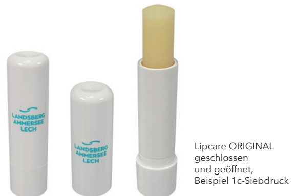
Lipcare ORIGINAL geschlossen und geöffnet, Beispiel 1c-Siebdruck