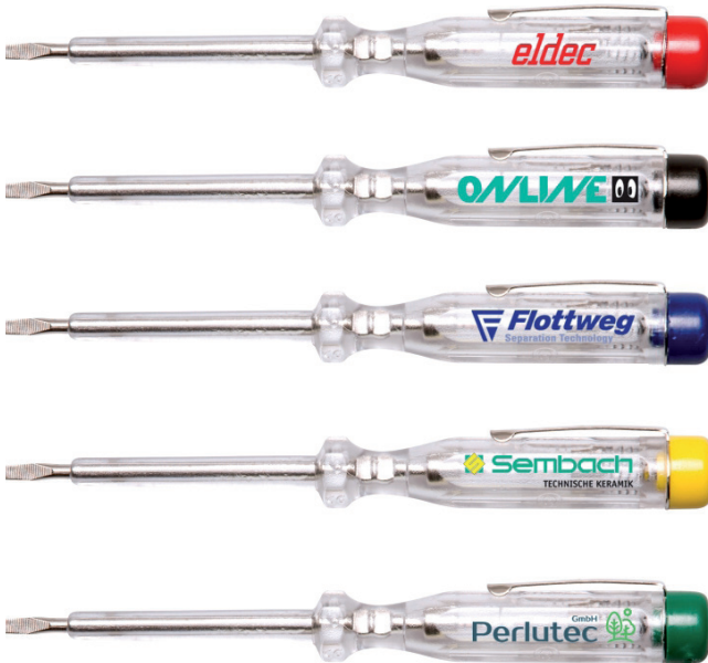
Beispiel Standardfarben, ein- oder zweifarbig bedruckt

Der Phasenprüfer eignet sich zum Feststellen einer Spannung an einer Leitung. Er besteht aus einer metallischen Klinge, einem Widerstand, einer Glühlampe und der Isolierung. Schneide 3 mm gehärtet und glanzvernickelt. Made in Germany und VDE-GS geprüft. Spannungsbereich: 125-250 Volt.