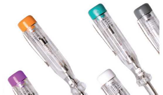
Beispiel individueller Pantonetton (ab 5.000 Stück gegen Aufpreis)