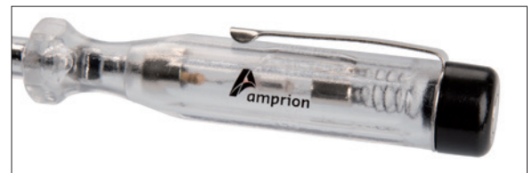
Beispiel Tampondruck 1-farbig