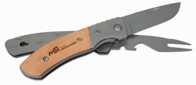
Leicht teilbar in Messer und Gabel

Lieferzeit: ca. 3 Wochen nach Produktionsfreigabe | Fixtermin? Fragen Sie nach unserem Express-Service!