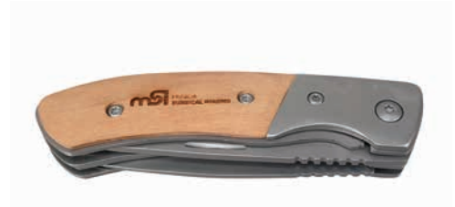
Beispiel Lasergravur auf dem Griff