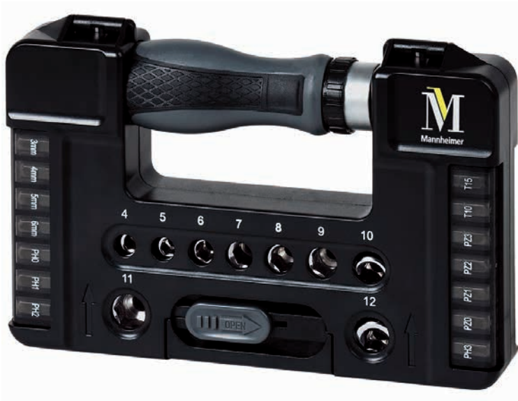
Bit-Set Tool Case L, Beispiel Druck

Dieses Bit-Set findet sowohl im häuslichen, als auch im handwerklichen bzw. industriellen Bereich Verwendung. Alle Bits sind aus hochwertigem CRV-Stahl 6150 Rockwell 56° gefertigt. Die magnetische Bitaufnahme des Schraubendrehers fixiert komfortabel das Bit. Durch einen hochwertigen Tampondruck oder Doming veredeln wir Ihr Bit-Set für eine optimale Logo-Präsentation.