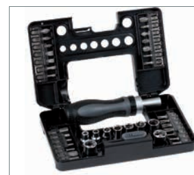
Tool Case L, geöffnet