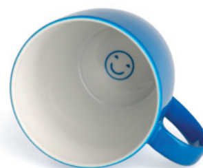
Beispiel Innendekor (auf Anfrage)