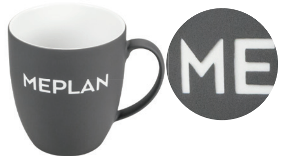
Beispiel Hydroglasur matt, Logogravur