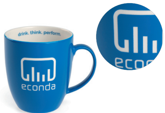
Beispiel Hydroglasur glänzend, Logogravur, Innendekor