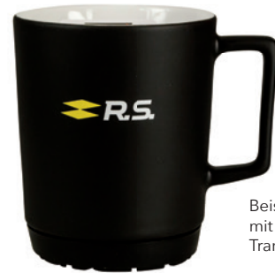
Beispiel Hydroglasur mit 2-farbigem Transferdruck