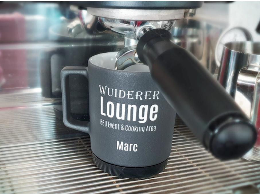
Softpad Mug Form 352, Beispiel Asphaltoptik mit Logogravur und Einzelnamen

Softpad Mug: Ein intelligenter Materialmix aus Porzellan und Silikon! Das Pad der Tasse funktioniert als eingebauter Untersetzer, der Kratzer auf hochwertigen Oberflächen vermeidet. Die Hydroglasur sorgt für brillante, CI-gerechte Farben, durch die Gravur ergibt sich eine effektvolle, hochwertige Werbeanbringung.