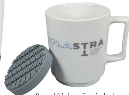
Beispiel 2-farbiger Transferdruck, Silikonpad in Sonderform Reifenspur (ab 1000 Stück möglich)

Farben Silikonpad (auf Lager, ab 500 Stück auch in Sonderfarbe)