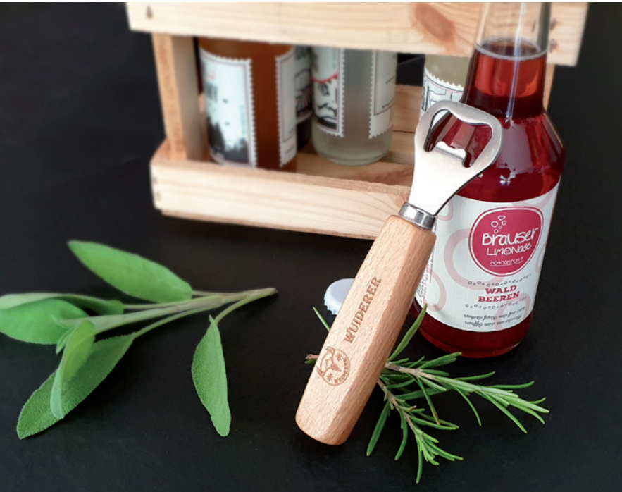
Flaschenöffner mit lackiertem Holzgriff, Beispiel Lasergravur