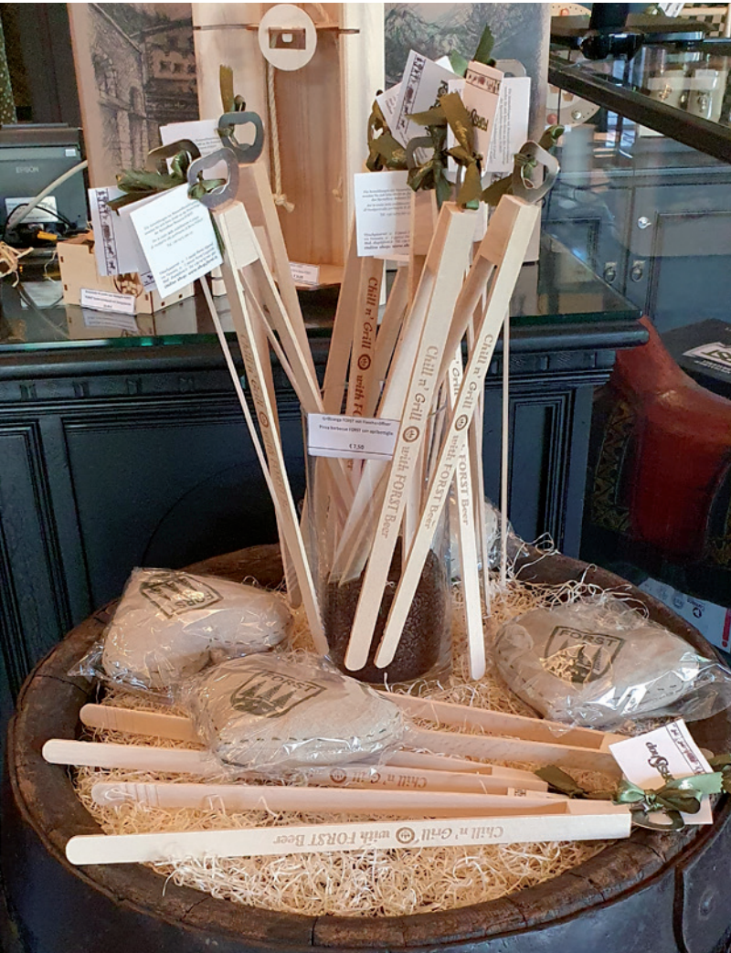
Beispiel Lasergravur (größere Werbefläche auf Anfrage)