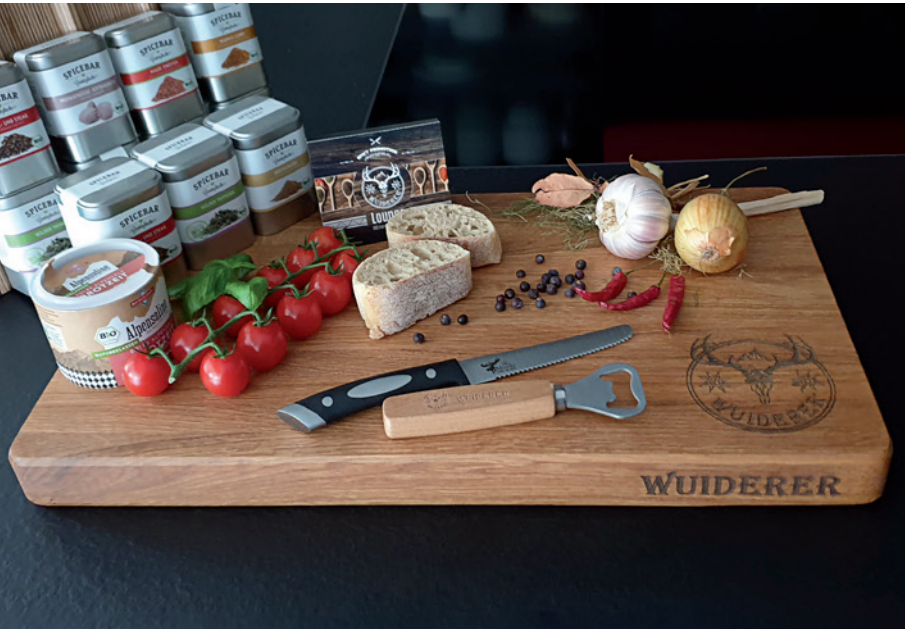
Profi-Hackblock, geölt, 50 x 30 x 4 cm, Beispiel Lasergravur

Profi-Hackblock aus Eichenholz mit Griffmulden mit einer Dicke von 4 cm : Die massiven Schneidebretter in Profi-Qualität ist in drei Größen erhältlich. : Das Brett eignet sich deshalb optimal für jeden Profi- oder auch Amateur-Koch. : Für das Brett wird Eichenholz längs verleimt und im Anschluss mit lebensmittel-echtem Hackblock-Öl geölt. : Mit ihrem Wunschmotiv als Brandstempel oder Lasergravur auf dem Schneidebrett macht das Kochen sicherlich noch mehr Spaß.