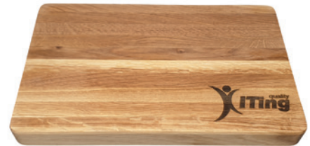
Profi-Hackblock, geölt, 40 x 25 x 4 cm, klein Beispiel Brandstempel

Unser Produkt online: « Bitte hier scannen!