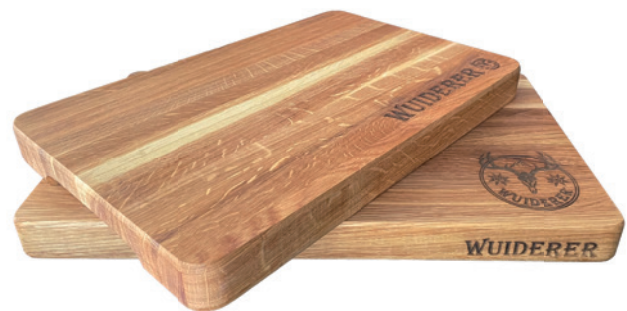
Profi-Hackblock, geölt, 45 x 30 x 4 cm, mittel Profi-Hackblock, geölt, 50 x 30 x 4 cm, groß Beispiel Lasergravur