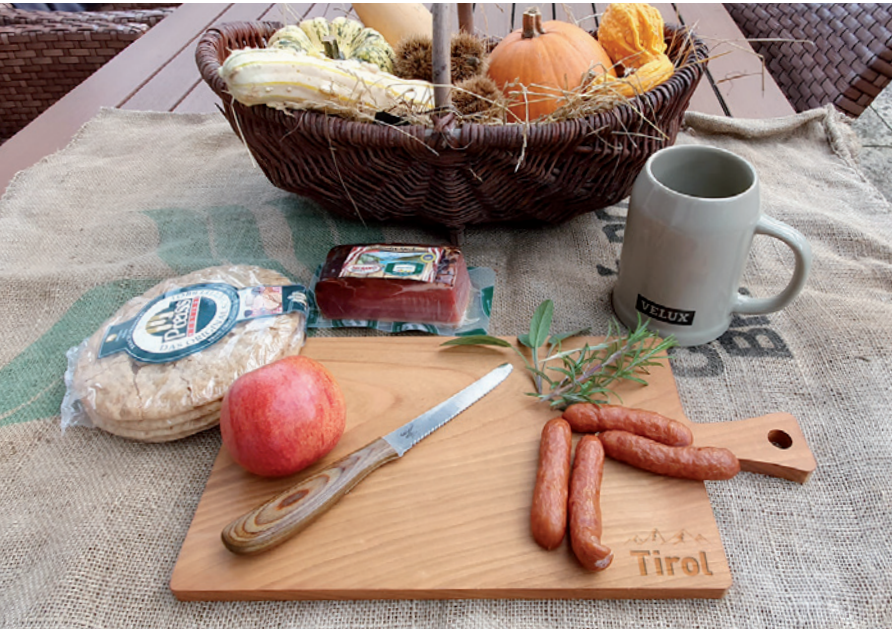
Brotzeitbrett mit Griff aus Kirschholz, Beispiel Lasergravur