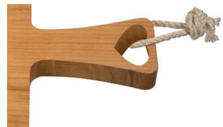
Beispiele Laserschnitt im Griff, optional mit Hanfkordel