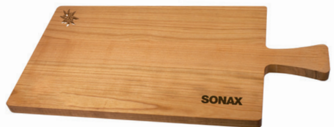
Brotzeitbrett geölt, 40 x 20 x 1,5 cm, Beispiel Brandstempel und Laserschnitt