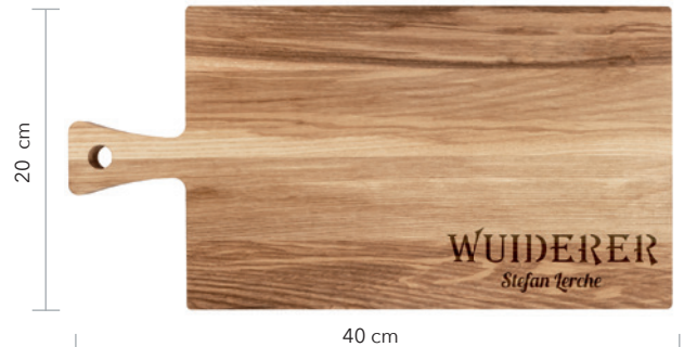
Beispiel Lasergravur mit individueller Personalisierung

Lieferzeit: ca. 2 Wochen nach Produktionsfreigabe | Fixtermin? Fragen Sie nach unserem Express-Service! Angebot freibleibend, Preise zzgl. MwSt. ab Werk, Irrtümer vorbehalten. Bitte senden Sie uns Ihre druckfähigen PDF- oder EPS-Daten inklusive Pantone Farbangaben zu.