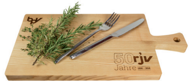
Schneidebrett ungeölt, Beispiel Brandstempel