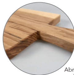
Abrunden(schleifen/fräsen) der Ecken und Kanten auf Anfrage möglich