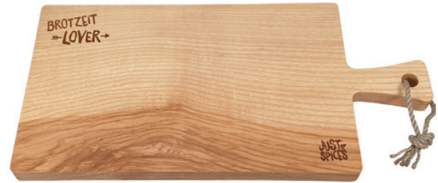
Schneidebrett geölt, konfektioniert mit Hanfkordel im Aufhängeloch, Beispiel Brandstempel

Schneidebrett mit Griff aus massivem Eschenholz : Auf dem Brett kann Ihr Logo mittels Lasergravur oder Brandstempel angebracht werden. : Auch Einzelpersonalisierungen sind möglich. Fragen Sie nach einem individuellen Sets mit passendem graviertem Brotzeitmesser.