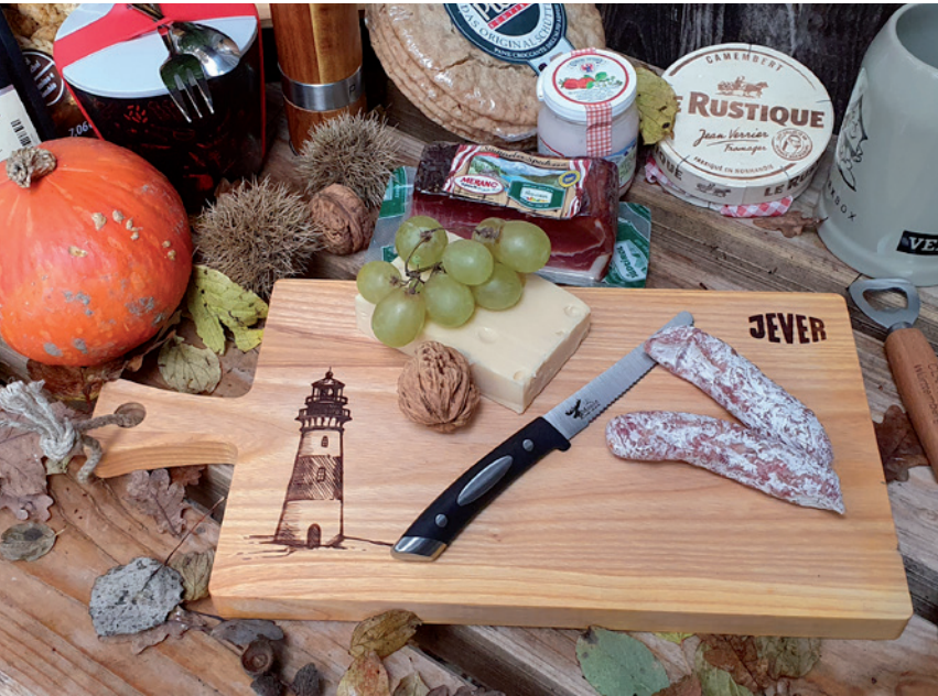
Schneidebrett aus Kernesche mit Griff und Hanfkordel, geölt, Beispiel Brandstempel