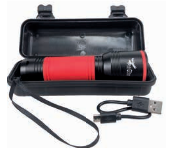
Inklusive Verpackung, Griffschlaufe und USB-Ladekabel

Lieferzeit: ca. 3-4 Wochen nach Produktionsfreigabe | Fixtermin? Fragen Sie nach unserem Express-Service!