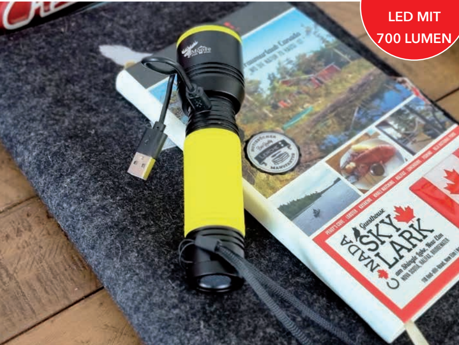
Taschenlampe myFLASH in schwarz mit gelber Silikonmanschette und -ring, Beispiel Lasergravur

Taschenlampe myFLASH 700 mit hochwertigem Voll-Aluminiumgehäuse : In der Taschenlampe ist eine 700 Lumen starke, Original Osram P8 LED-Leuchte (Farbe Weiß) eingebaut, Gehäuse in zwei Farben erhältlich : Die Taschenlampe kann individuell konfiguriert werden durch 17 verschiedene Farben für Silikonmanschette und -ring. Auch ohne Silikonkomponenten erhältlich : Zoombarer Lichtkegel zoombar und mit maximaler Leuchtreichweite von 376 m : Fünf integrierte Lichtmodi: high, mid, low, Flashlight und SOS : Wiederaufladbar per Mikro-USB-Anschluss und inklusive USB-Ladekabel. : Der Mikro-USB-Anschluss befindet sich unter dem Lichtkegel-Zoom am Taschenlampen-Kopf