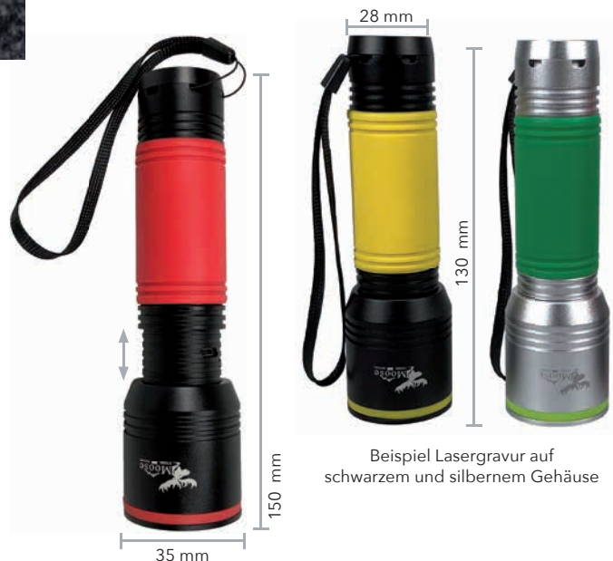
Beispiel Lasergravur auf schwarzem und silbernem Gehäuse