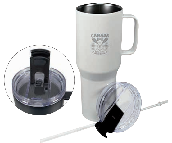
Verschließbare Trinkhalm- und Flip-Lip-Öffnung

Lieferzeit: ca. 2 Wochen nach Produktionsfreigabe | Fixtermin? Fragen Sie nach unserem Express-Service!