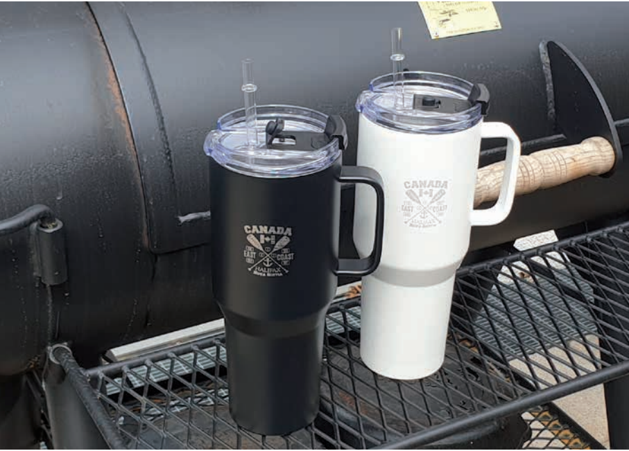
GRAND CANYON in schwarz und weiß, Beispiel Lasergravur