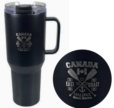
Hochwertiger Trinkbecher mit Griff, Beispiel Lasergravur