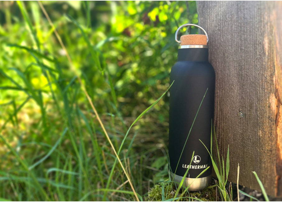
ORTADO, Beispiel Lasergravur