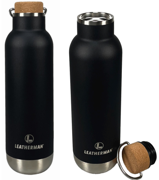
Trinkflasche ORTADO mit Korkdeckel und Metallhenkel