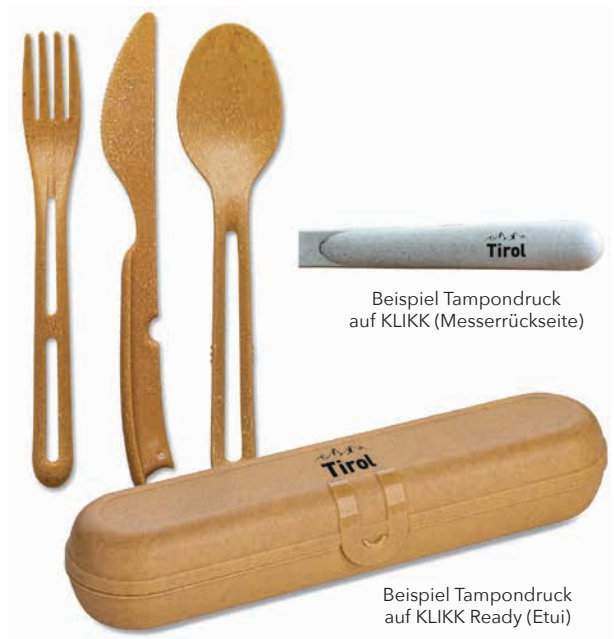
Beispiel Tampondruck auf KLIKK (Messerrückseite)

Hier erfahren Sie mehr zu dem neuen, nachhaltigen Material Bio-Circular.