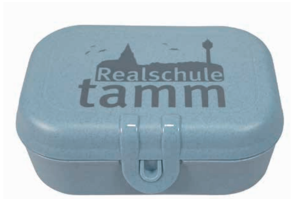
Beispiel 1-farbiger Druck