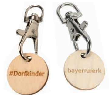
GREEN COIN, Beispiel Lasergravur und Karabinerhaken