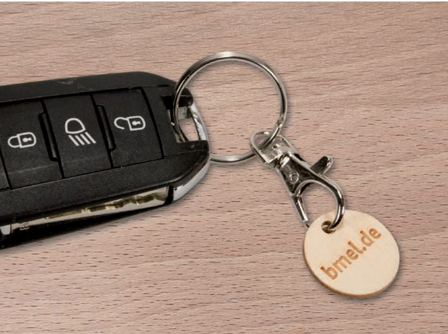
GREEN COIN, Beispiel Lasergravur