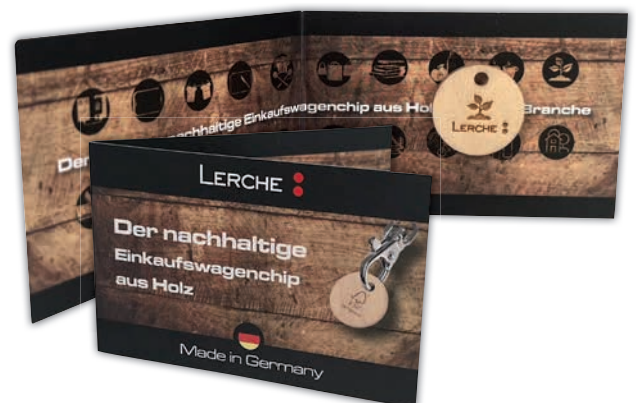
Individuell bedruckte Klappkarte auf Anfrage

Lieferzeit: ca. 3-4 Wochen nach Produktionsfreigabe | Fixtermin? Fragen Sie nach unserem Express-Service!