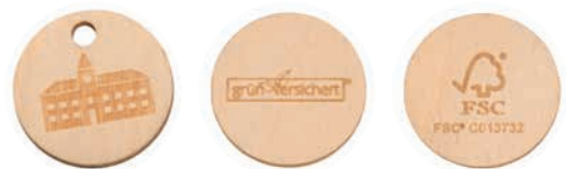
GREEN COIN mit oder ohne Bohrung, Beispiel Lasergravur, Standard-Rückseite mit FSC-Logo