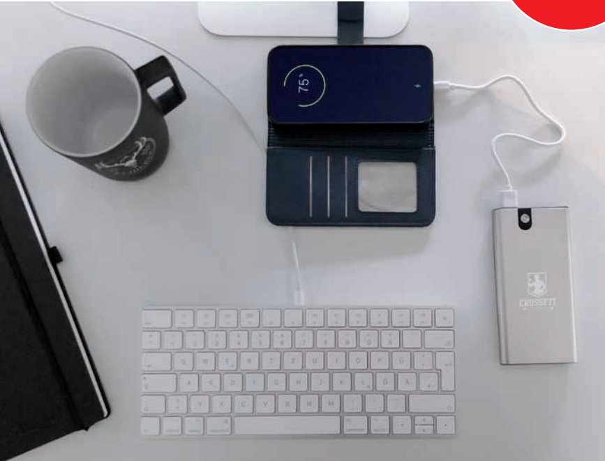
Powerbank FLAT10, Beispiel Lasergravur