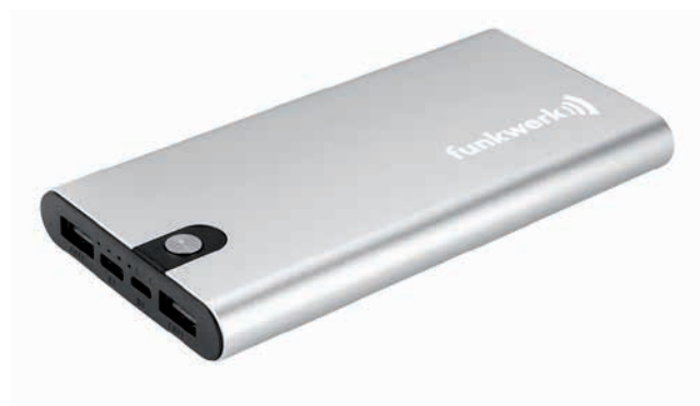
Powerbank FLAI 10, Beispiel Lasergravur