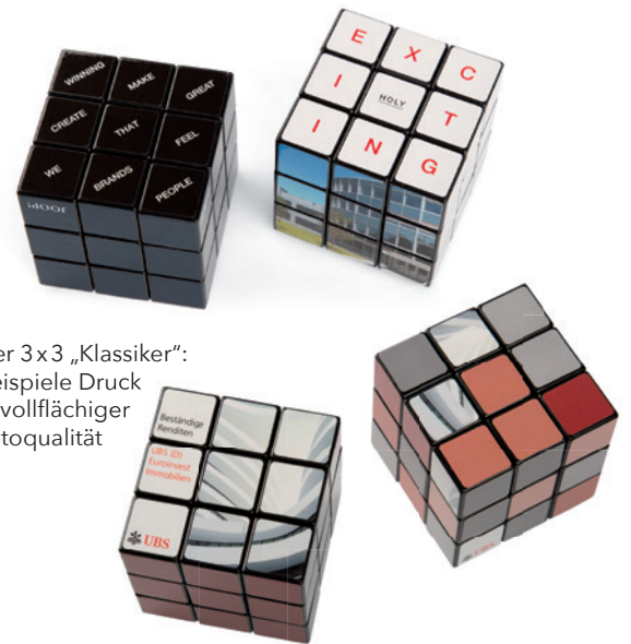
Der 3x3 „Klassiker“: Beispiele Druck in vollflächiger Fotoqualität