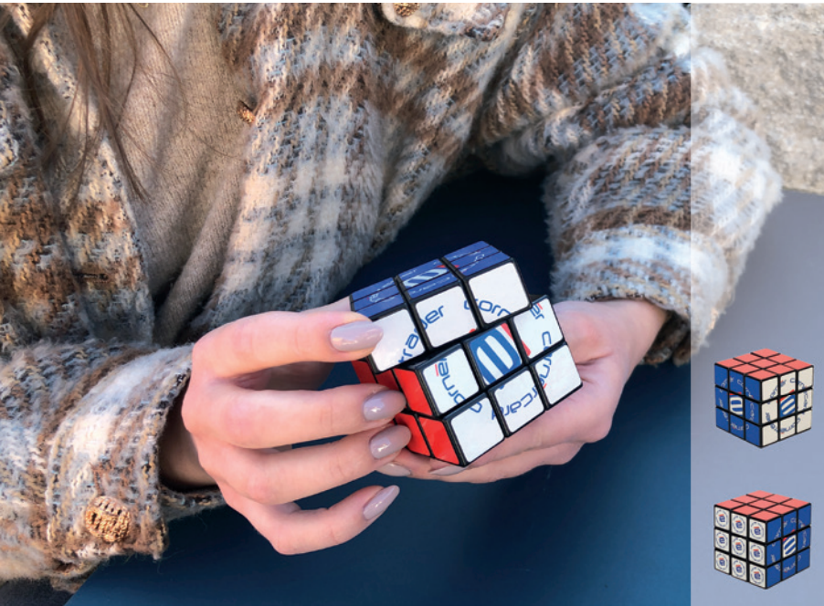
Beispiel 3-seitiger Druck

Der Zauberwürfel ist erhältlich als Klassiker mit 3x3 Werbeflächen oder als Sonderformate mit 2x2 oder 4x4 Werbeflächen.