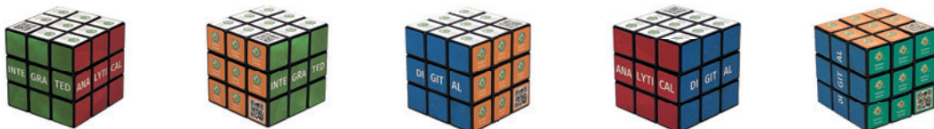
Beispiel 6-seitiger Druck

Lieferzeit: ca. 5 Wochen nach Produktionsfreigabe | Fixtermin? Fragen Sie nach unserem Express-Service!