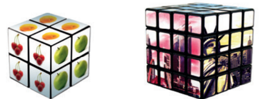
Format 2x2 mit größeren, vollflächigen Werbeflächen, auf Anfrage möglich