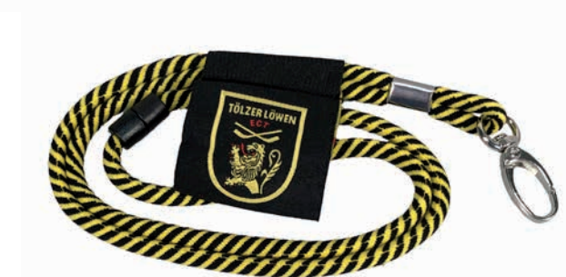
Beispiele Kordel-Lanyards in Brand-Farben mit Logolabel

Lieferzeit: ca. 2 Wochen nach Produktionsfreigabe | Fixtermin? Fragen Sie nach unserem Express-Service! Angebot freibleibend, Preise zzgl. MwSt. ab Werk, Irrtümer vorbehalten. Bitte senden Sie uns Ihre druckfähigen PDF- oder EPS-Daten inklusive Pantone Farbangaben zu.