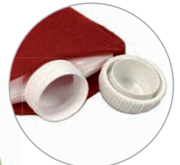
Extra große Öffnung zum einfachen Befüllen