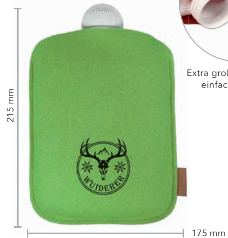
Wärmflasche UNNY mit Wollfilz-Bezug, Beispiel 1-farbiger Siebdruck