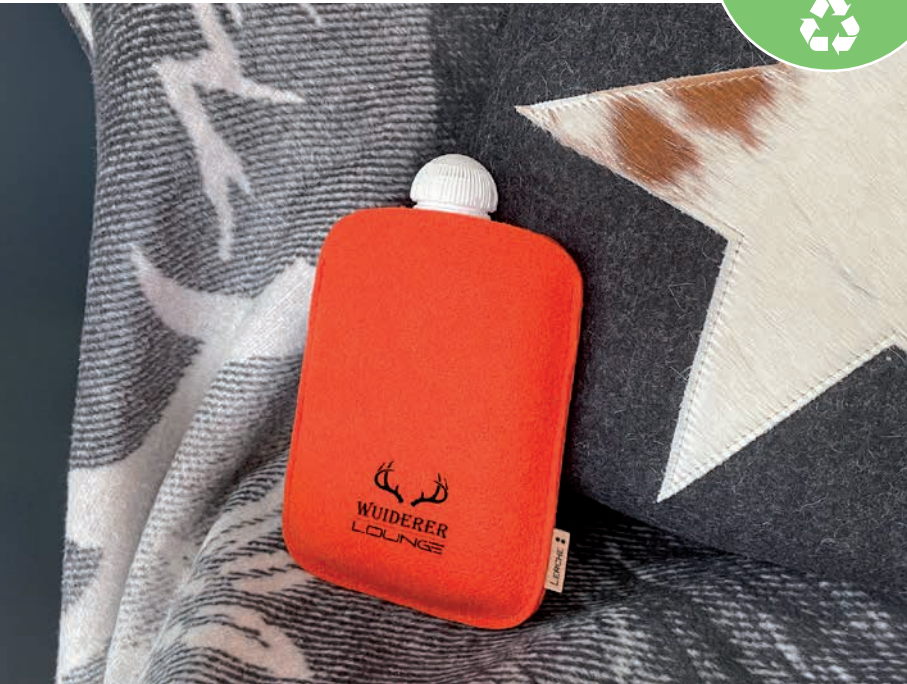
Nachhaltige Wärmflasche UNNY mit Upcycling rPET-Filz-Bezug

Artikelnummer: 0281-0505-2021/-2022 (Woll-/rPET-Filz) Material: Natur-Wollfilz oder Upcycling rPET-Filz Größe: 17,5 x 21,5 cm Füllmenge: 800 ml Farben: Wollfilz: gelb, hellorange, terracotta, rot, bordeaux, pink, lavendel, himmel, royal, dunkelblau, maigrün, oliv, schwarz, sand, hellgrau. rPET-Filz, uni: gelb, orange, kirschrot, weinrot, fuchsia, stahlblau, indigo, jade, steingrau, schwarz rPET-Filz, melange: magnolie, gletscher, jeansblau, minze, anthrazit. Weitere Farben auf Anfrage.