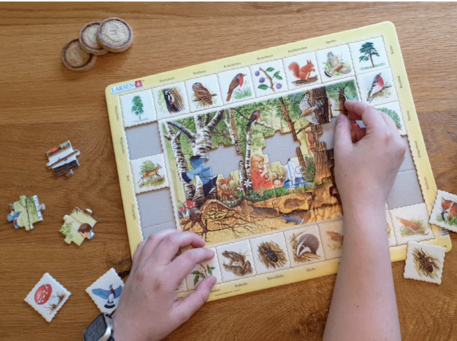
Beispiel 4-farbig bedrucktes Puzzle