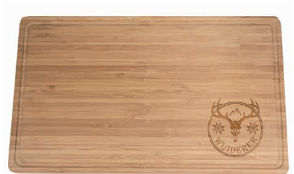
Bambus-Tranchierbrett, 45 x 27 cm, 2,5 cm stark, Beispiel Lasergravur

Lieferzeit: ca. 3-4 Wochen nach Produktionsfreigabe | Fixtermin? Fragen Sie nach unserem Express-Service!