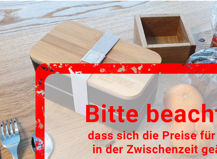
Lunchbox NAGANO (18,2 x 10,2 x 10 cm), Beispiel Lasergravur