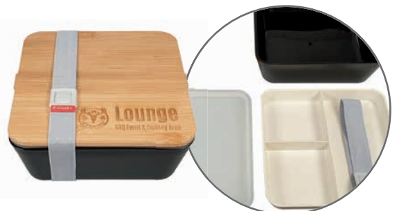
Quadratische Lunchbox SAITAMA (19 x 19 x 8,5 cm), einstöckig mit Trennelementen, Beispiel Lasergravur

Lieferzeit: ca. 3 Wochen nach Produktionsfreigabe | Fixtermin? Fragen Sie nach unserem Express-Service!