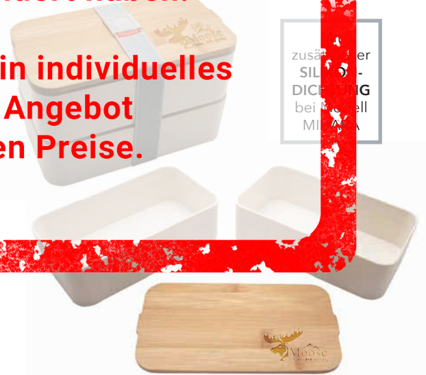
Lunchbox MIHARA (19 x 10,5 x 11,5 cm), Beispiel Lasergravur, Bambusdeckel kann auch als Schneidebrett verwendet werden