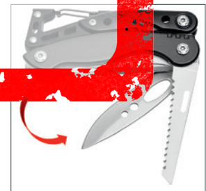
Öffnung von außen