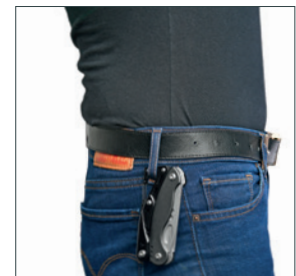
Am Gürtel fixierbar