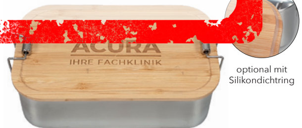
Mit Bambusdeckel und Clipverschlüssen