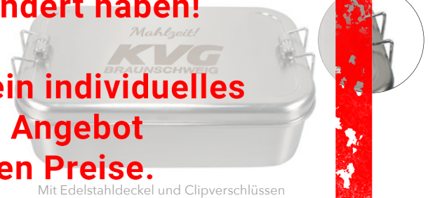
Mit Edelstahldeckel und Clipverschlüssen