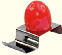
Edelstahl-Eierbecher auf Anfrage erhältlich