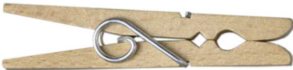
Die Zuverlässige • 72 mm

Buchenholz-Wäscheklammer / Beechwood clothes peg