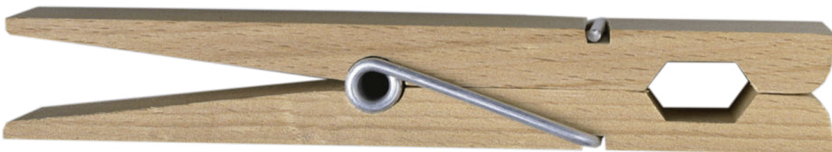
Die Riesige 150 mm

Buchenholz-Rundkopf-Klammer / Beechwood round-headed peg