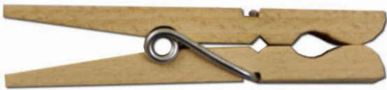
Buchenholz-Klammer • 72 mm

Buchenholz-Kleinklammer / Beechwood miniature-peg