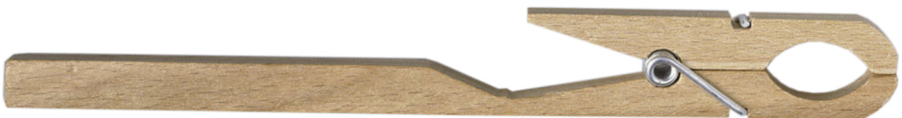
Die Reagenzglas-Klammer • 175 mm