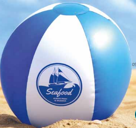
9620 Aufblasbarer Wasserball aus PVC, inklusive Mundstück Maße Ø 26 cm Druckfläche 80 x 150 / 80 x 125 mm Druckcode TSB-HKB / TR100-HKB Optimale Abnahmemenge 50 / 300