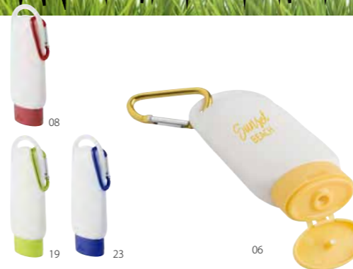
7575 Sonnenschutz-Creme 'Sunny' aus Kunststoff, Karabinerhaken aus Metall, wasserabweisend, Inhalt ca. 0,06 ltr. Maße 12,7 x 4,7 x 2,2 cm Druckfläche 30 x 30 / 25 x 10 mm Druckcode TB-HKC Optimale Abnahmemenge 50 / 200