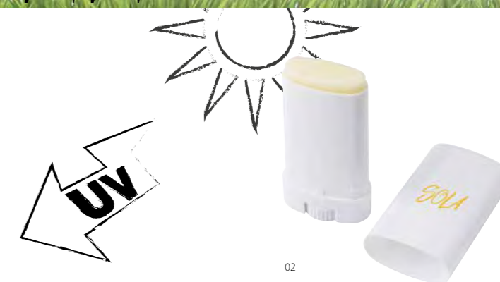
7577 Sonnenschutz 'Blogger' aus Kunststoff, Lichtschutzfaktor 30 Maße 7,5 x 3,8 x 2 cm Druckfläche 20 x 50 mm Druckcode TB-HKB Optimale Abnahmemenge 50 / 500