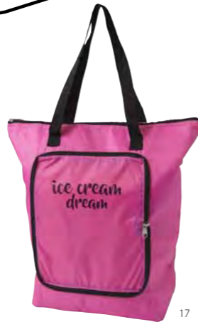
7294 Kühltasche 'Shopping' aus 210D Polyester, verwandelbar, Vortasche, Tragegriffe Maße 42 x 39,8 x 13 cm Druckfläche 70 x 35 / 140 x 140 mm Druckcode TSB-HKD / TB-HKB Optimale Abnahmemenge 80